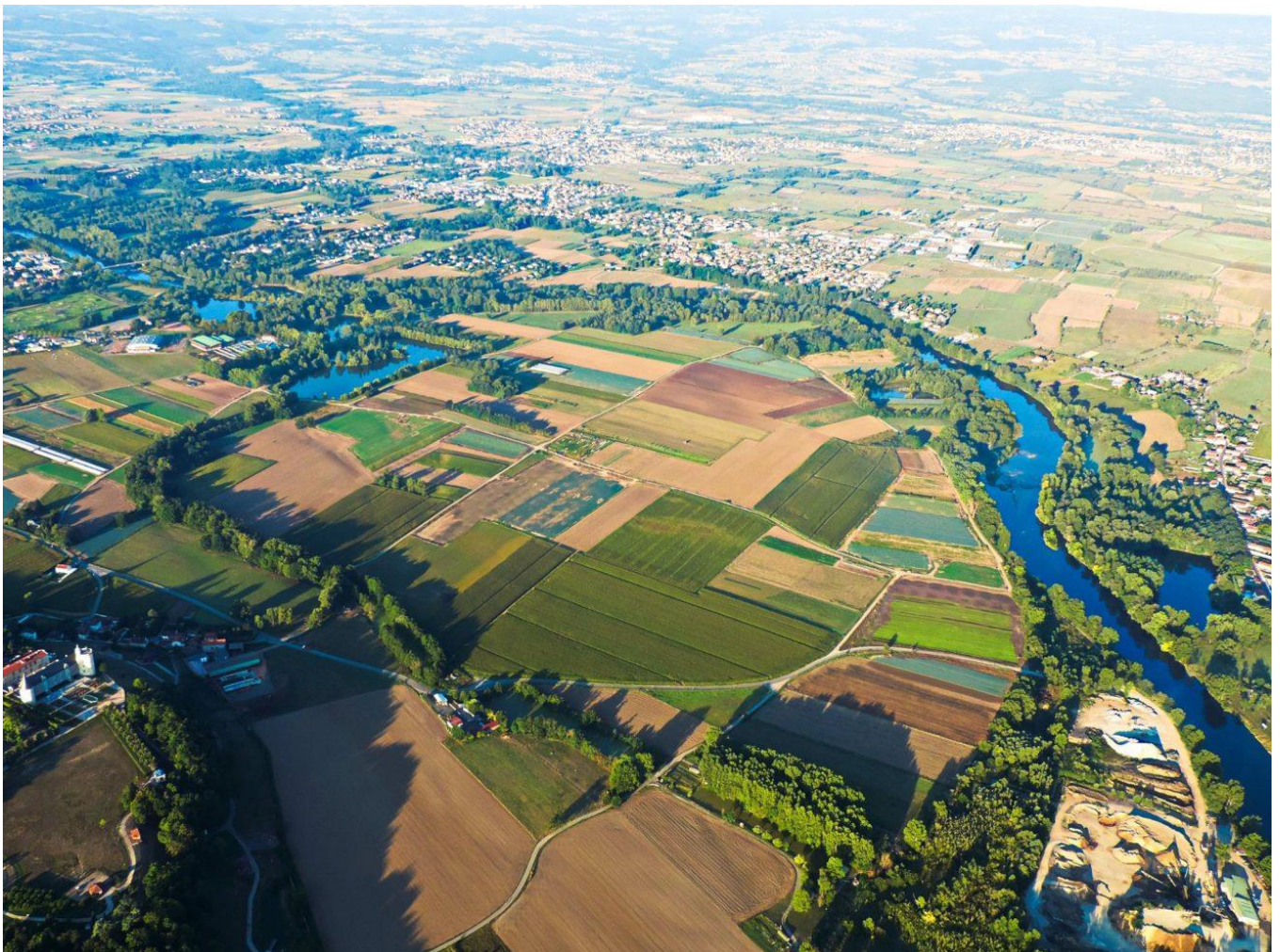
Bouthéon, les cultures, la Loire et son bras mort ~ © Philippe Guyot

Le nom BOUTHÉON vient peut-être du gaulois Bod-on : « la bosse au-dessus du fleuve ». En bas, les Chambons, du gaulois cambo, « courbe du fleuve », devenu dans la bouche des paysans « champ bon » tant ces terres d'alluvions étaient fertiles. La bosse et les courbes : le château et ses terres, un seul regard depuis les hauteurs.