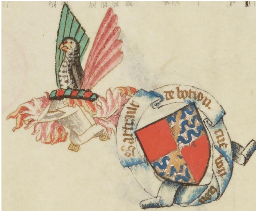
Berland de Bouthéon Armorial de Guillaume Revel, XVème siècle

La famille de Bouthéon est l'une des plus anciennes familles nobles du Forez. Elle est attestée dans les chartes de la région depuis le XIIe siècle. C'est probablement sous leur autorité qu'est érigé le premier château de pierre, une tour fortifiée construite avec deux matériaux locaux : les galets de la Loire et le grès houiller, pierre issue du bassin minier stéphanois.